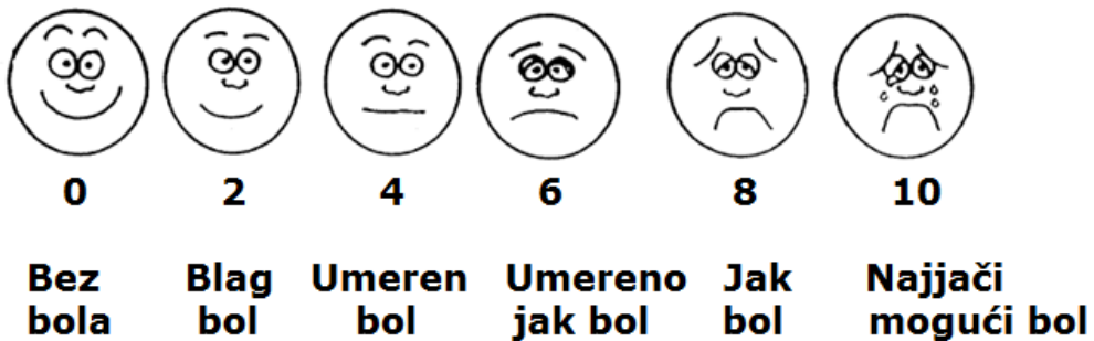
Slika 1. Skale za određivanje intenziteta bola.