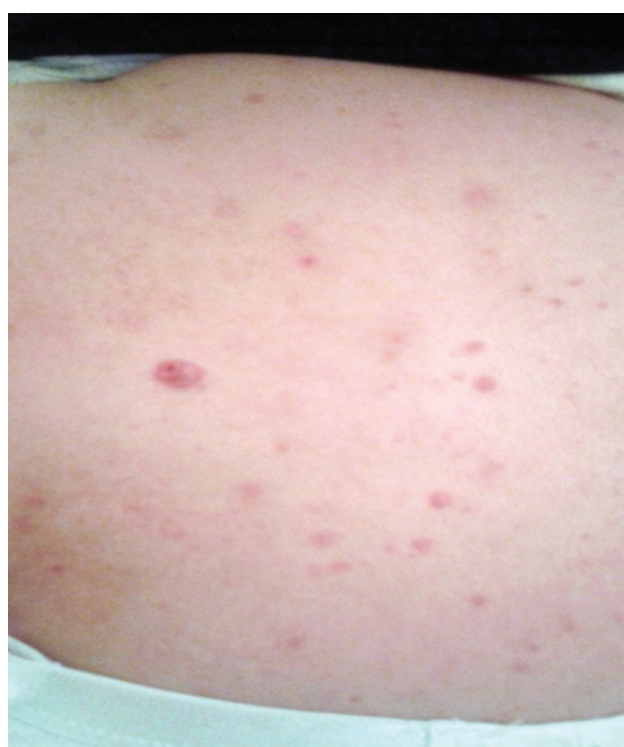
Slika 4. Pojedinačne, jasne formacije boje kože, veličine oko 0,5 cm, s palpabilnim tumorskim nodulima ispod njih na leđima

leđima, i to: pojedinačne, jasne formacije boje kože, veličine oko 0,5 cm sa palpabilnim tumorskim nodulima ispod njih (slika 4) i male žućkasto prebojene papilomatozne prominencije. Kod bolesnice su urađene i rutinske laboratorijske analize krvi koje su bile u granicama referentnih vrednosti.