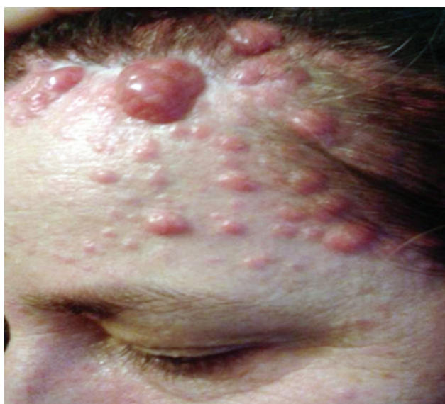
Slika 2. U predelu čela i na poglavini brojne tumefakcije sjajne, glatke površine mestimično s teleangiektazijama