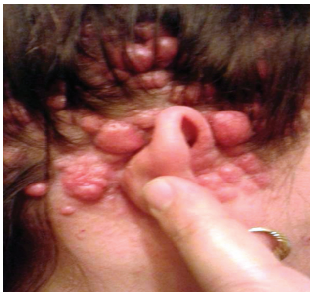
Slika 3. Multiple tumefakcije sličnih karakteristika u retroaurikularnom predelu