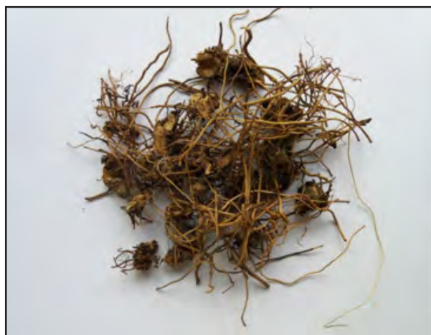
Slika 1. Telekia speciosa (Schreb.) Baumg. nadzemni dio - lijevo i korijen – desno