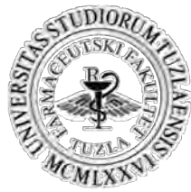
Farmaceutski fakultet Univerziteta u Tuzli