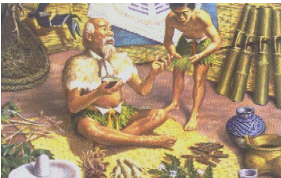
Slika 1. Proizvodnja lekova nekada...

Priča o lekovima počinje davno, u vreme kada su se u svrhe lečenja uglavnom koristile biljke. Postoje ideogrami koji pokazuju da su još 5000 godina pre nove ere (p.n.e.) Sumeri koristili opijum, a Egipćani 3500 godina p.n.e. proizvodili i koristili alkohol. Prvi pisani trag koji opisuje ovu oblast datira još iz 2735. godine p.n.e. kada je kineski car Shen Nung (slika 1) napisao knjigu o lekovitim biljkama i njihovoj upotrebi (1).