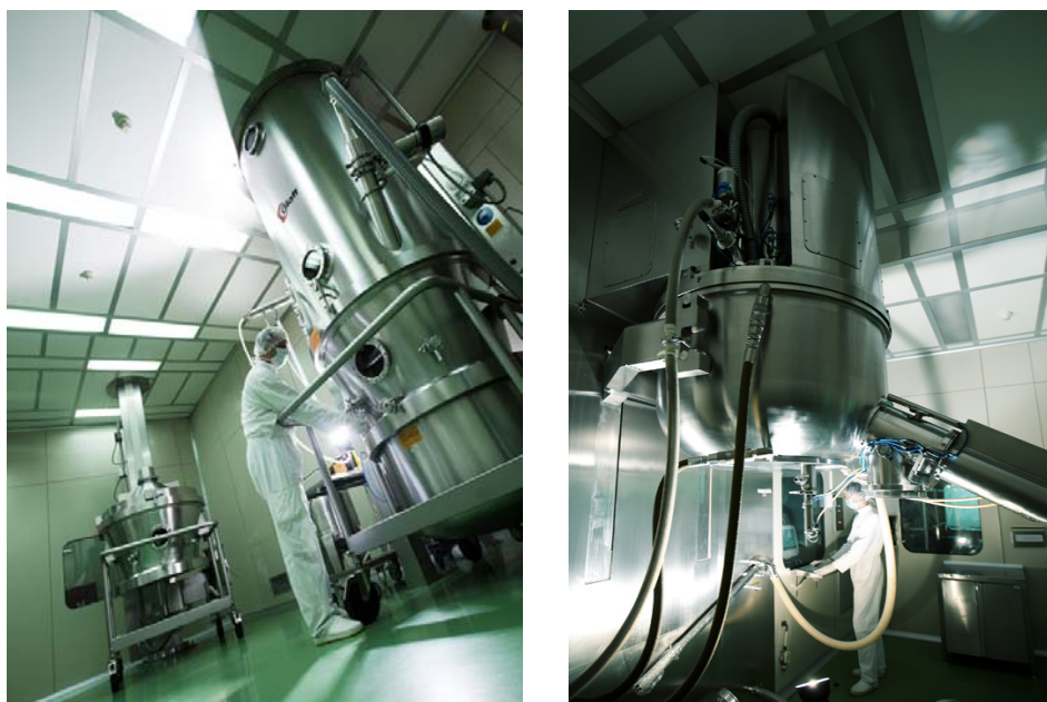
Slika 2. Savremena farmaceutska, industrijska proizvodnja

Istovremeno se razvijaju i analitičke, instrumentalne tehnike, koje se sve više koriste u ispitivanju lekova. Uvođenje separacionih, najčešće hromatografskih metoda, dešava se osamdesetih godina prošlog veka i tada se pojavljuju prvi rezultati koji ukazuju na pojavu brojnih degradacionih proizvoda, kako u lekovitoj supstanci, tako i u gotovom proizvodu. Tako se otvaraju vrata novog poglavlja u definisanju kvaliteta lekova u dužem vremenskom intervalu, kakvo zahteva današnja savremena farmaceutska industrija (slika 2).