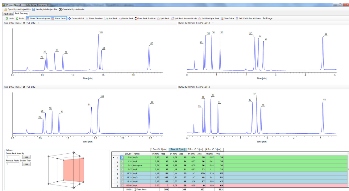
Slika 1. Praćenje pikova (Peak Tracking)

Da bi se dobili optimalni uslovi, DryLab® zahteva unos retencionih vremena i površine pikova komponenti uzorka iz inicijalnih hromatografskih analiza. Praćenje pikova (eng. peak tracking ) je opcija softvera koja predstavlja automatsko prepoznavanje pikova komponenti u dve ili više hromatografskih analiza na osnovu njihove površine. Praćenje pikova se može izvesti jednostavno i tačno uz pomoć površine pikova ukoliko je injekcioni volumen uzorka konstantan pri izvođenju osnovnih eksperimenata ( basic runs ).