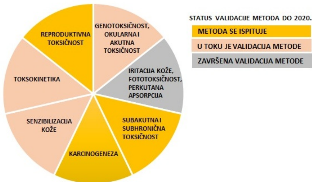
Slika 2. - Status validacije alternativnih metoda kao zamena za testove na životinjama do 2020. (10)