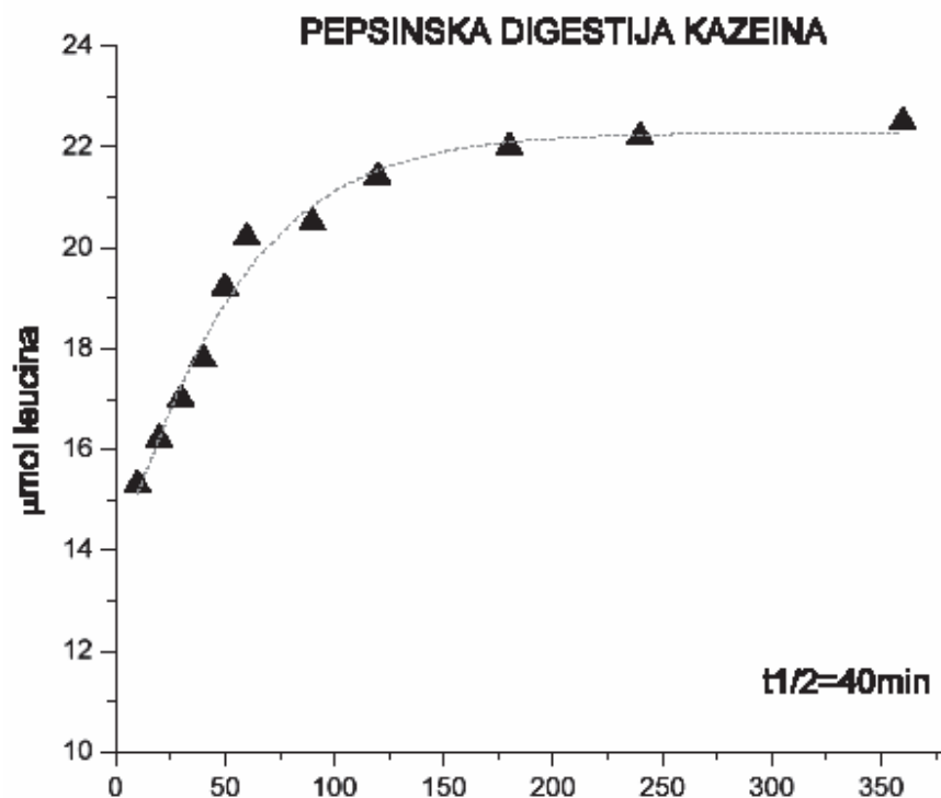
Slika 2. PRIKAZ KINETIKE 0-TOG REDA PEPSINSKE DIGESTIJE KAZEINA IZRAŽENOG U JEDINICAMA LEUCINA.

Mnogobrojne studije su pokazale da dugoročan povećan dnevni unos kalcijuma (1500mg/dnevno) dovodi do povećanja koštane mase kod bolesnika sa osteoporozom i samim tim smanjuje se broj fraktura koja je najčešća posledica ove bolesti (4). Dnevne potrebe za ovim mineralom mogu se zadovoljiti unosom odgovarajuće hrane, pri čemu treba imati u vidu da je bioiskoristljivost kalcijuma iz namirnica različita. Sir, kao mlečni proizvod, jedan je od najboljih izvora kalcijuma, ne samo što sadrži relativno veliku količinu ovog minerala, već i zato što je odnos kalcijuma i fosfora veoma dobar (kravlji sir Ca/P 1,3). Studije na životinjama su pokazale da unos dijetarnog kalcijuma i fosfora u odnosu 2:1 ima pozitivan uticaj na mineralizaciju kostiju (5). Značajno je napomenuti i da je bioiskoristljivost kalcijuma iz sira, koji je u obliku Ca-kazeinata (6), dodatno povećana u odnosu na druge dijetarne izvore, u kojima je kalcijum uglavnom u jonском ili neorganskom obliku. Naši prethodni eksperimentalni rezultati su pokazali da poluvreme pepsinske digestije kazeina iznosi t_{1/2}=40\text{min} , (Slika 2). Na osnovu prethodne činjenice može se očekivati da se \frac{1}{2} dijetarnog kalcijuma (koji se nalazi u obliku Ca-parakazeinata) apsorbira za 40 minuta, što predstavlja značajnu prednost u odnosu na druge dijetarne izvore koji imaju sporiju kinetiku.