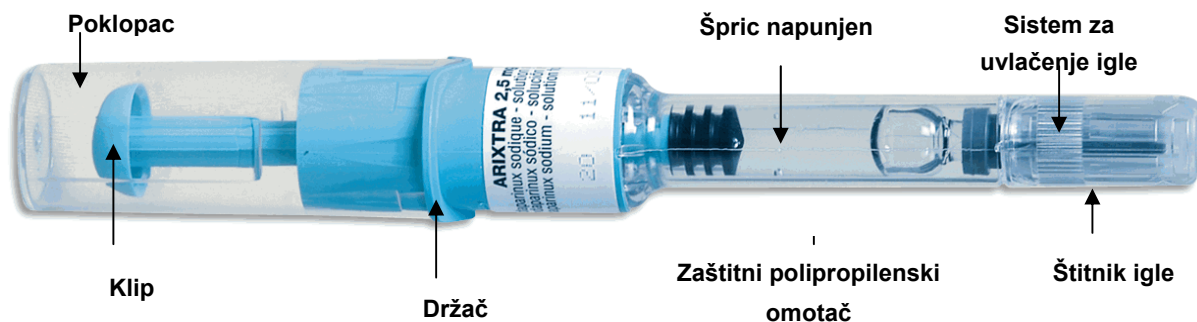
Slika 2. Arixtra® rastvor za s.c. injekciju u injekcionom špricu. ( http://www.gsksource.com/ )(Accessed/poslednji pristup: 27. 04. 2013.). Figure 2. Arixtra® solution for s.c. injection in pre-filled syringe. ( http://www.gsksource.com/ )(Accessed/poslednji pristup: 27. 04. 2013.).